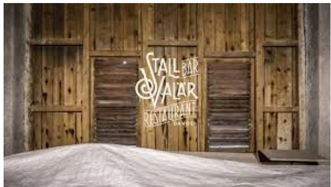
Restaurant Stall Valär